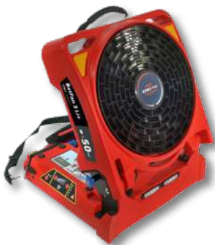
Variante mit Akku