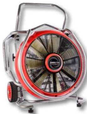
Variante mit Verbrennungsmotor