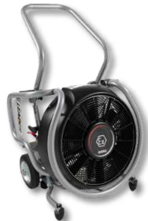
Variante mit Elektromotor und Elektromotor nach ATEX