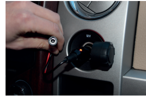
12V Kfz Anschluß