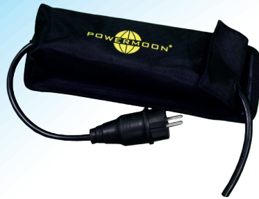
230V AC Netzteil